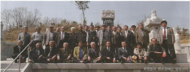
회원들이 현조경배단 앞에서

大宗會 第11차 정기총회 2014. 3. 20. 마친 후 마무리를 짓기 위하여 4월 20일 대종회 임원들이 각지역에서 참석하여 위촉장 수여를 하였다. 바쁜중에도 처음으로 모이는 부회장들이 많이 참석하시어 기쁨이 넘쳤다. 위촉장은 각 문중 대표인 부회장들이 함께 모여 종친회 발전을 위하여 논의하였고 금년엔 족보발간을 위해 논의하였다. 종중에 발전을 위해 임원진들이 단합하여 계속적으로 숙원사업을 이루고 각 파 문중에도 힘을 합쳐 승조상문의 역군이 됩시다.