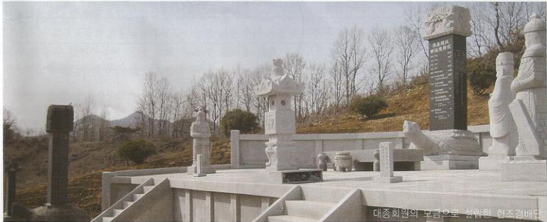
대종회원의 모듬으로 완공된 현조경배당